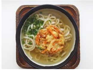
かきあげうどん 250円