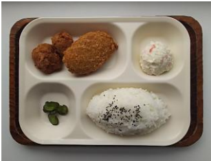
ヒシコロランチ 350円