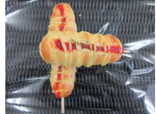
あらびきフランク