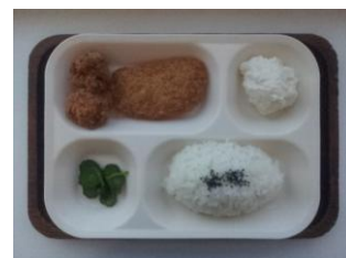
ミルク定食 350 円