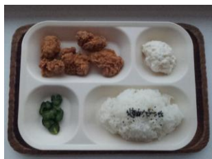
からあげ定食 350 円