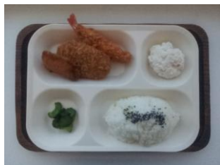
週替り A ランチ 350 円