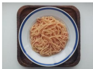
たらこパ 300 円