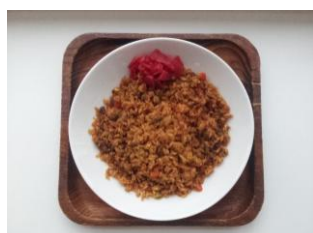
ドラカレー 250 円