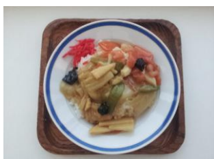
中華飯 380 円