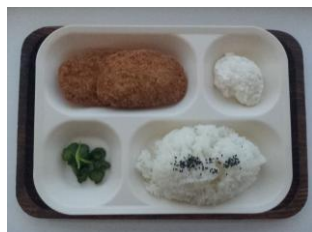
とんかつ定食 350 円