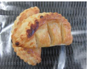
国産りんごのアップルパイ