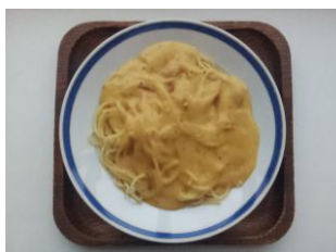
カレーナラ 300 円