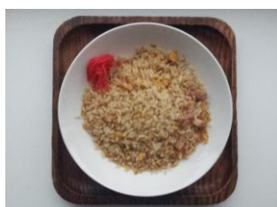
チャーハン 250 円