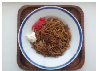
やきそば 200 円