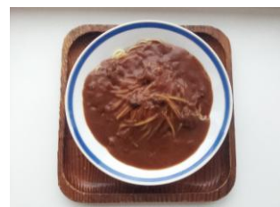
カレーパ 300 円