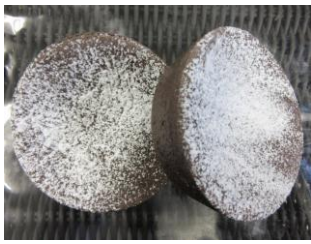
フォンダンショコラ