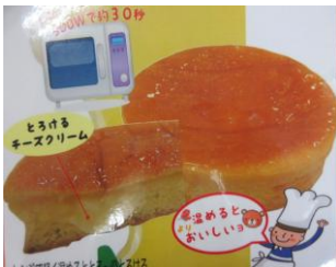
とろけるチーズケーキ