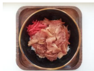
豚しゃぶ丼 380 円