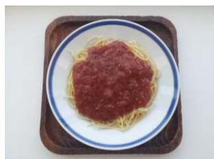
ミートパゲティ 300 円