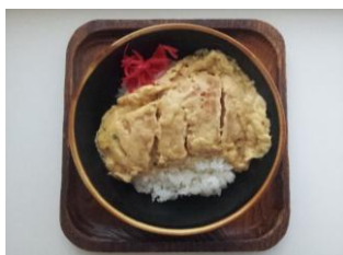
加判 380 円