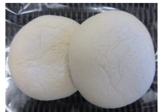
白いクリームチーズパン