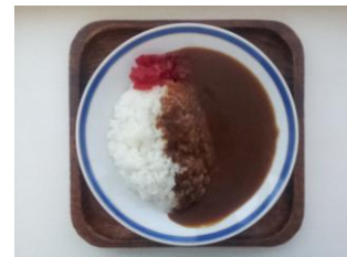
カレーライス 300 円