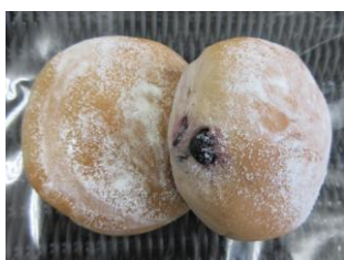
ブルーベリーロール