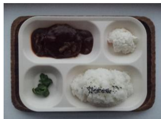
ハバーグ定食 350 円