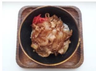
豚丼 380 円