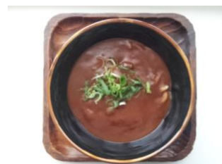
カレーうどん 300 円