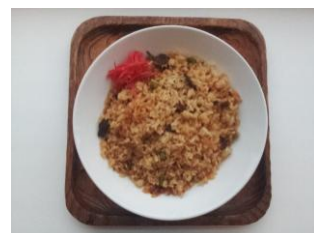
焼肉ビビンバ 250 円