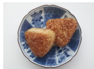
焼きおにぎり 100 円