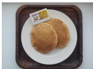
ホットケーキ 150 円