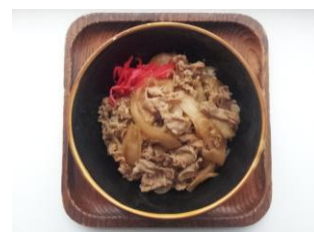
牛丼 380 円