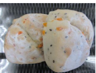
国産小麦のチーズ&セサミ