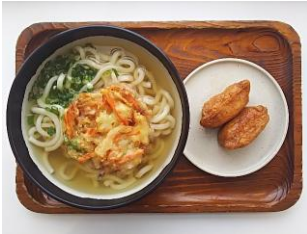
かきあげセット 340円