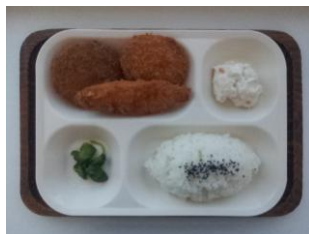
週替り B ランチ 350 円