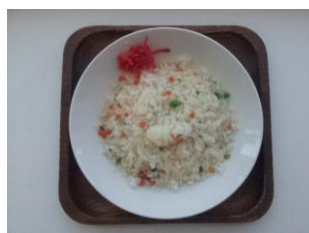
ビビンバ 250 円