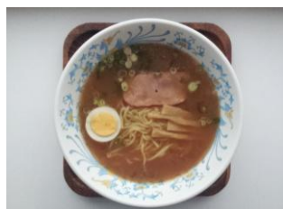
ラーメン 300 円