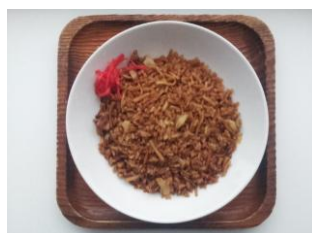
そばめし 250 円